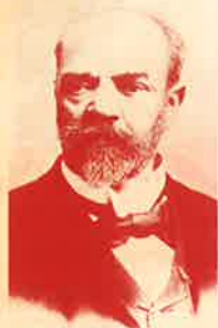
Conductor Tatsunobu Goto

BCPO 別府市民 フィルハーモニア 管弦楽団 Beppu Citizens Philharmonia Orchestra